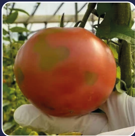
ANTES DO TRATAMENTO