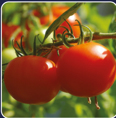
TRATADO COM AG FORT